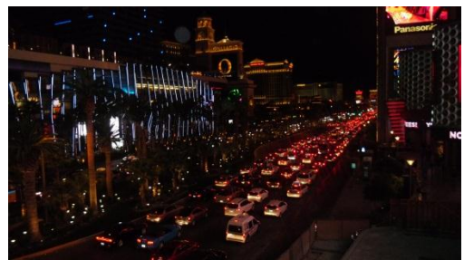
Der Las Vegas Boulevard, oder auch Strip mit dem Bellagio und dem Caesars Palace