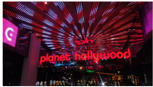
Eingang des Planet Hollywood Kasinos

Ich hoffe ihr freut euch schon auf meinen nächsten Artikel.